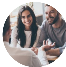
Kanzlei & Praxis