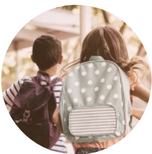
Schule & Bildung