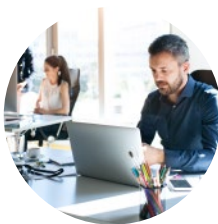
Büro & Konferenz