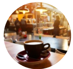
Restaurant & Geschäft