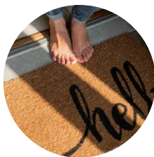
Wohnen & Hotel